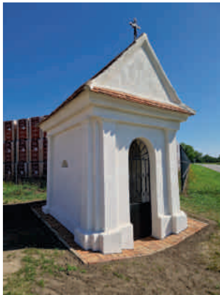
Rekonstruovaná kaplička u cihelny.