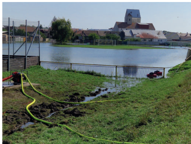
Přibývá vody na hřišti, probíhá odčerpávání vody. Na hřišti u paty hráze se objevují vývěry o průměru 5 cm, hráz je zpevňována pytlí s pískem, aby se zamezilo průsakům.