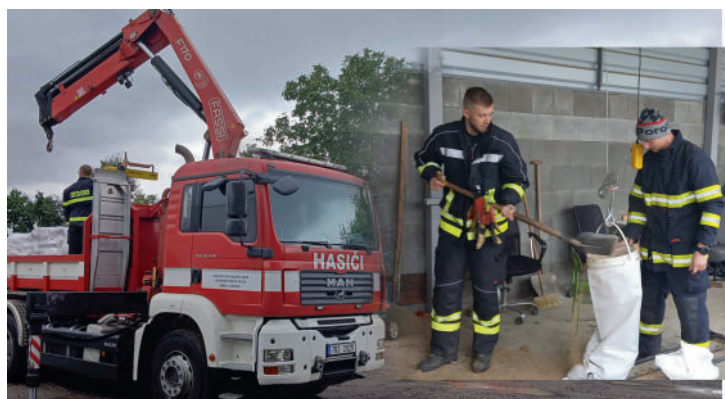
2. stupeň povodňové aktivity – 14.9., zajištění pytlů s pískem a kritických objektů. První část pytlů byla plněna ručně v areálu technických služeb, později byly pytle dodány Hasičským záchranným sborem.