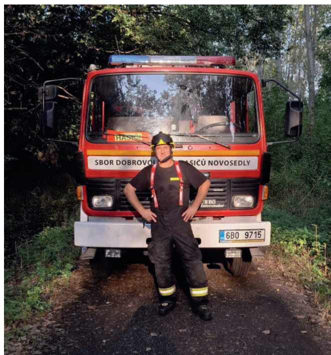
Výsledek: 1000 – pytlů s pískem – cca 25t 520 hodin – odsloužených členy JSDH Novosedly