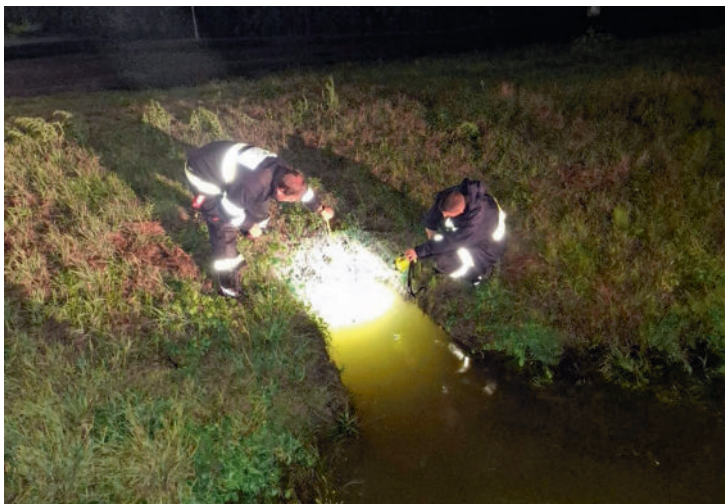
Monitoring kritických míst probíhal nepřetržitě 1x za 2 hodiny. Hladina řeky Dyje byla sledována od pátku každou hodinu.