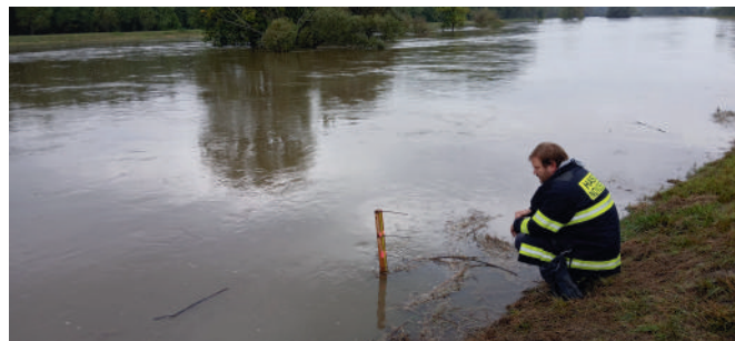
3. stupeň povodňové aktivity - 15.9. 50 cm od koruny hráze Dyje za HTS, voda stoupá rychlostí 3cm/h, kulminace v nedohlednu, předpovědi jsou stále pesimističtější, naštěstí přestává pršet.