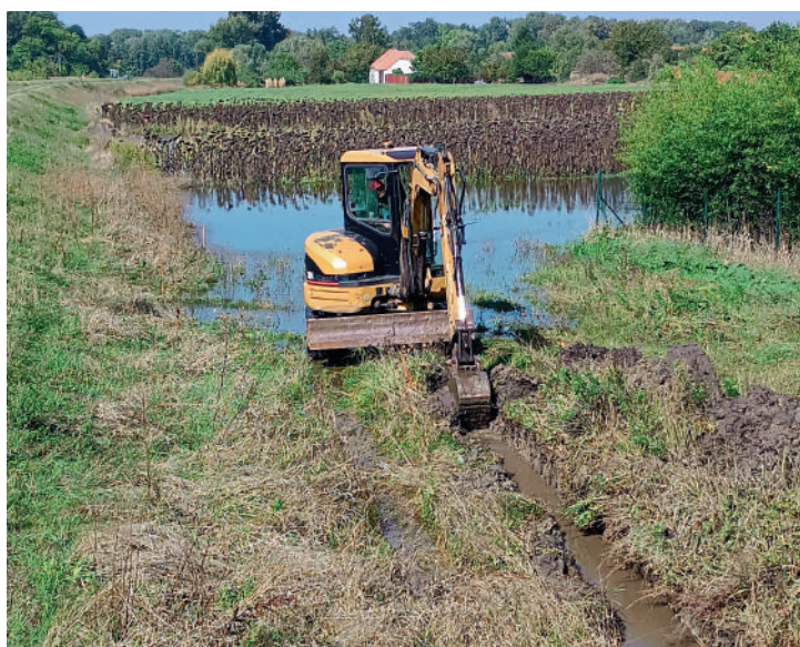
Prohloubení strouhy pro odvod vody ze zaplavaného fotbalového hřiště. Po jejím prohloubení voda pozvolna odtékala. Akci nejprve muselo schválit Povodí Moravy, jako správce toku Polního potoka, protože se jednalo o práce v blízkosti hráze.