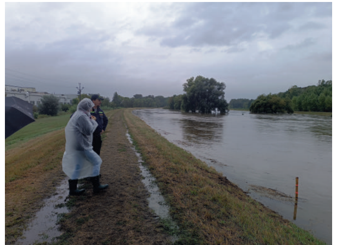
Povodně září 2024, hladina Dyje se zastavila půl metru pod korunnou hráze. Na snímku provizorní hladinoměr, který byl sledován každou hodinu.