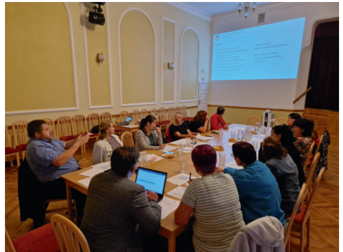
Hodnocení výsledků dotazníků na druhém workshopu projektu Family Friendly Community.

Rozložení vyplněných dotazníků dle jednotlivých životních fází.