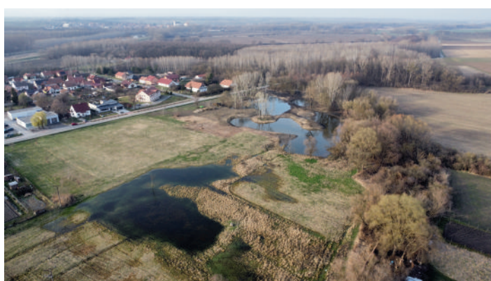
Slanisko po proměně.

přírodu. Následovala dlouhá a poutavá diskuze občanů dychtivých po doplnění informací. Jsme velice rádi za kladné reakce, které tuto akci následovaly.