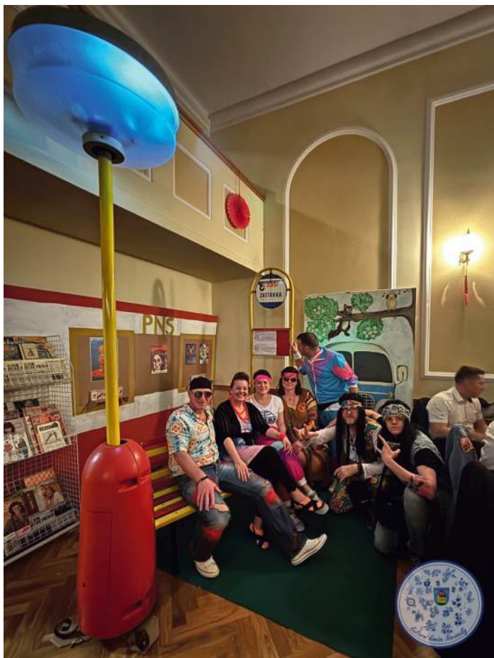
Letošním tématem plesu Retro MDŽ byla doprava.