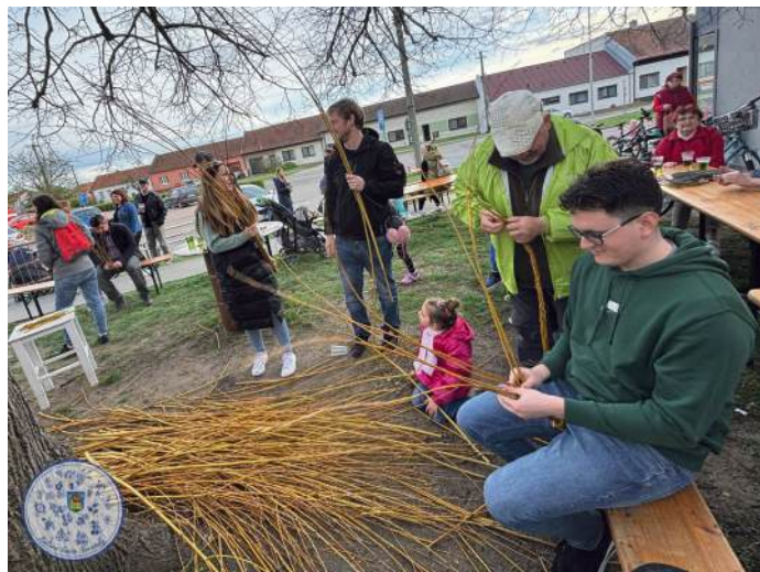
Zelený čtvrtek u bývalé evangelické modlitebny.

V sobotu 13. dubna k nám zavítali ochotníci z Pohořelic se svým divadelním představením Šéf na kmíně. I když sál nebyl naplněn, smíchu bylo mnoho. Děkujeme za příjemný kulturní zážitek.