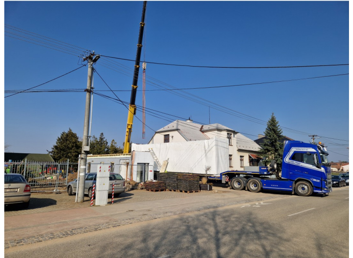
Instalace jednotlivých modulů stavby. Usazení bylo technicky náročné z důvodu zavěšeného elektrického vedení. Po několika hodinách byly všechny moduly usazeny na vybudované základové pasy.