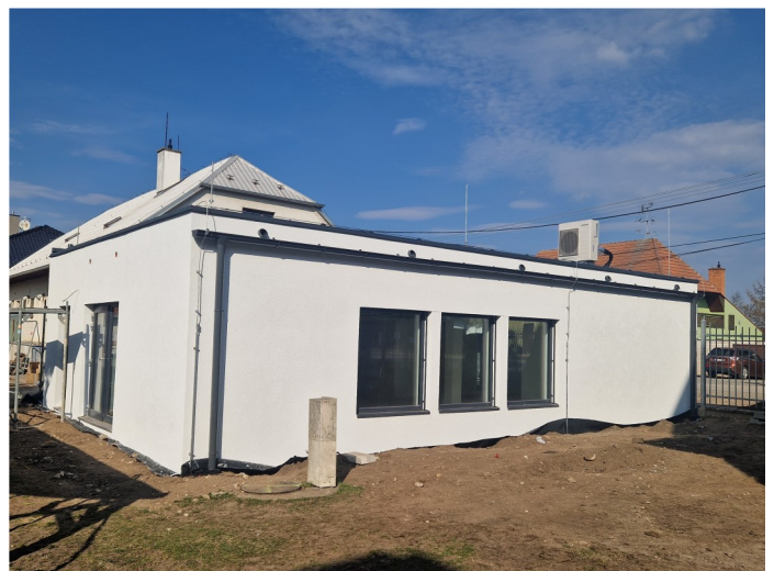
Práce finišují, je hotová fasáda, klempířské prvky, fotovoltaická elektrárna i klimatizace.