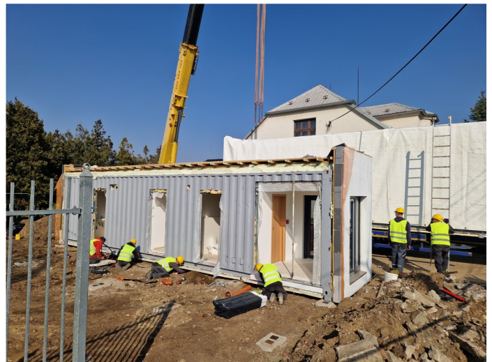
Pohled do prvního usazeného modulu.