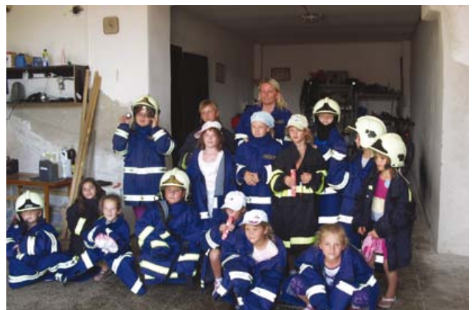
Fotografie: 2x příměstský tábor