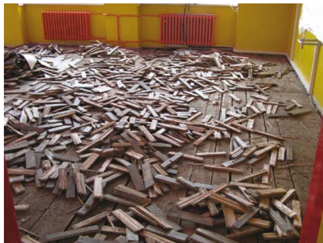
Fotografie: 2x oprava podlahy. Pokračování na další straně.