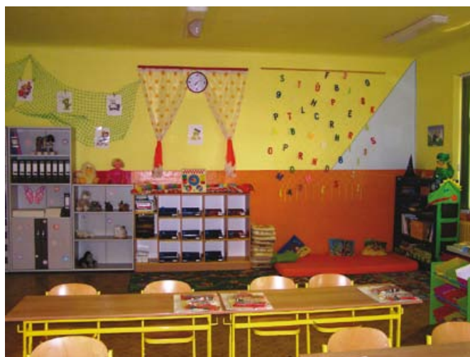
Fotografie: 2x oprava podlahy, 2x nový školní nábytek, 2x výzdoba třídy prvňáčků.